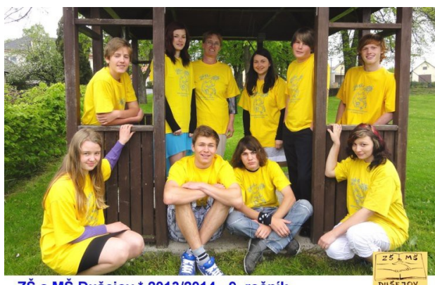
ZŠ a MŠ Dušejov * 2013/2014 - 9. ročník

Všichni žáci byli přijati na ty obory, na které si podali přihlášku.