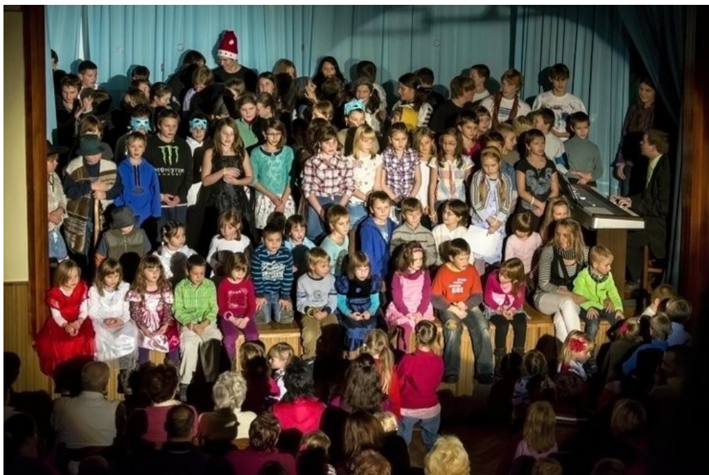
Obrázek č. 12: Závěr vánoční besídky_____