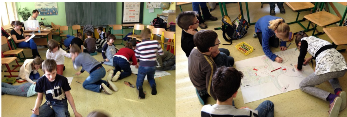
Obrázek č. 6 a 7 Akce Vrakbaru pro IV. a V. třídu