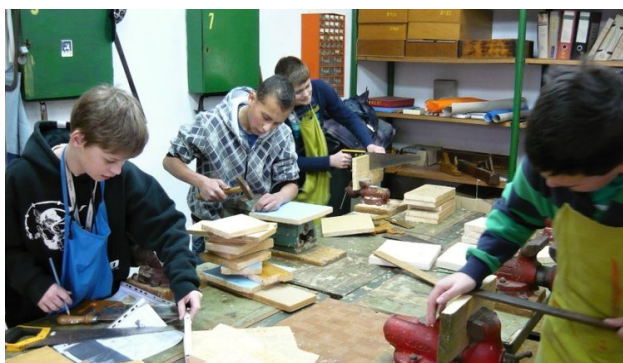
č. 11: Plnění úkolů v rámci branného kurzu