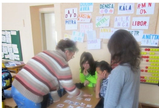
Obrázek č. 10: Žáci VI. třídy při práci v dílnách v hodině Pv Obrázek