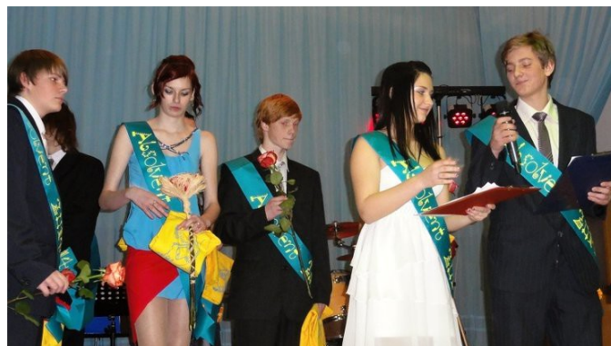
Obrázek č. 8 a 9: Žáci IX. třídy na XII. Školním plese