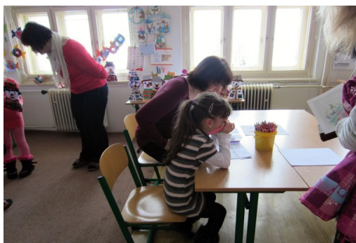
Obrázek 1 a 2: Zápis do I. třídy

Zápis do I. třídy pro školní rok 2014/2015 se konal 24. ledna 2014. Bylo zapsáno 13 dětí z mateřské školy. Ředitelka školy rozhodla, že jedno děvče dostane odklad povinné školní docházky na základě žádosti zákonných zástupců a doporučení PPP v Jihlavě a dětského lékaře. Z loňska měly odklad dvě děti. Do první třídy tedy nastoupí 1. září 2014 čtrnáct prvňáčků.